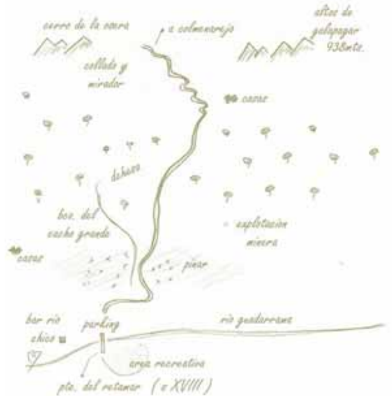
Croquis de la ruta

Desde éste, contemplaremos el paisaje urbano de la capital y, si miramos hacia el norte, el pueblo de Colmenarejo y al fondo las cumbres de Guadarrama.